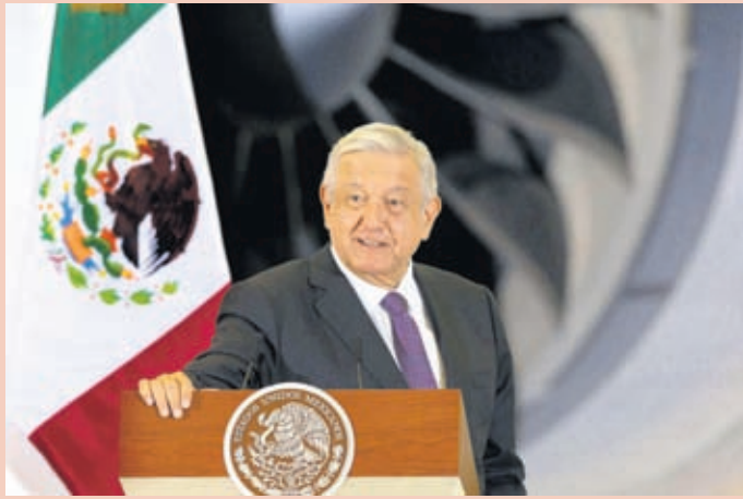
Mexican President Andres Manuel Lopez Obrador gives his daily, morning press conference in front of the former presidential plane at Benito Juarez International Airport in Mexico City, Monday, July 27, 2020.